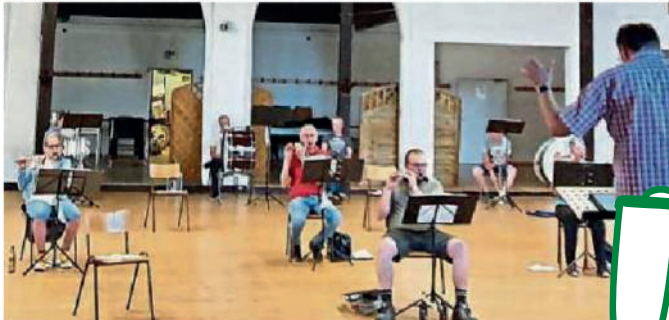
Das Tambourcorps durfte endlich wieder musizieren.