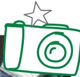
Alma-Park (01. März 2020)